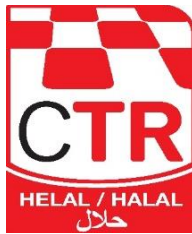
CTR Helal Ürün Markası