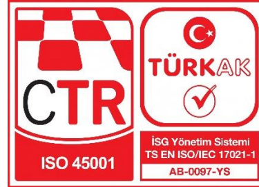
CTR TÜRKAK Akreditasyonlu ISO 45001

İş Sağlığı ve Güvenliği Yönetim Sistemi Markası