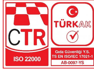
CTR TÜRKAK Akreditasyonlu ISO 22000