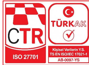
CTR TÜRKAK Akreditasyonlu ISO 27701