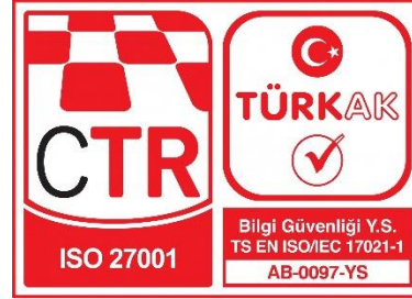
CTR TÜRKAK Akreditasyonlu ISO 27001