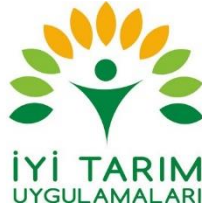
İyi Tarım Uygulamaları Markası