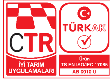
CTR TÜRKAK Akreditasyonlu İyi Tarım Uygulamaları Markası