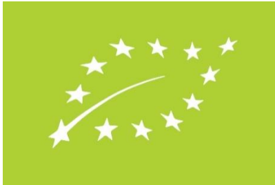
Organik Tarım – AB Markası