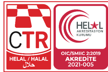
CTR HAK Akreditasyonlu Helal Ürün Markası